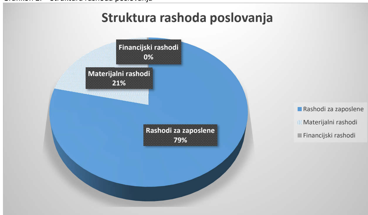
Grafikon 2. – Struktura rashoda poslovanja